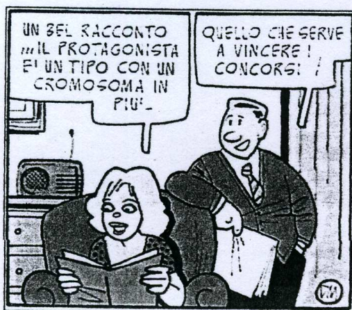
Illustrazione di Danilo Maranotti

Milano («Panta, certo, vera panta»), Renzo Mosca di Brescia («Vorrei un grande amore»), Luca Gammaitoni di Perugia («Il buco nella rete») e Ugo Ricciarelli di Pisa («Come vi ho fatto impennare l'audience»). Tutti premiati con un milione di lire. ■